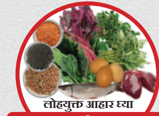
लोहयुक्त आहार घ्या