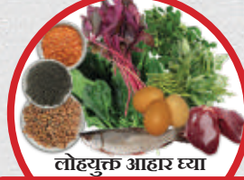
लोहयुक्त आहार घ्या