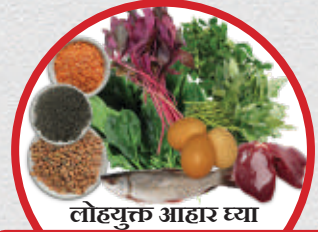
लोहयुक्त आहार घ्या