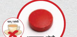
जीवनसत्त्व-क युक्त आहार घ्या.