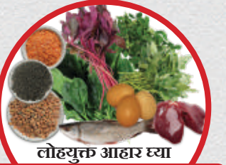
लोहयुक्त आहार घ्या